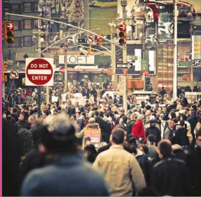
纽约的街道, 美国