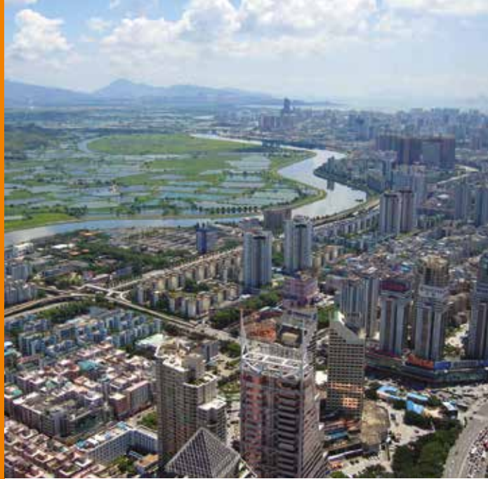
深圳俯瞰, 中国