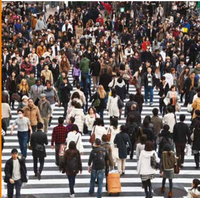
东京的行人,日本

城市与区域规划能够在诸多领域促进可持续发展，它应该与可持续发展的三个互补方面紧密联系：社会发展和社会包容、可持续经济增长、以及环境保护和管理。