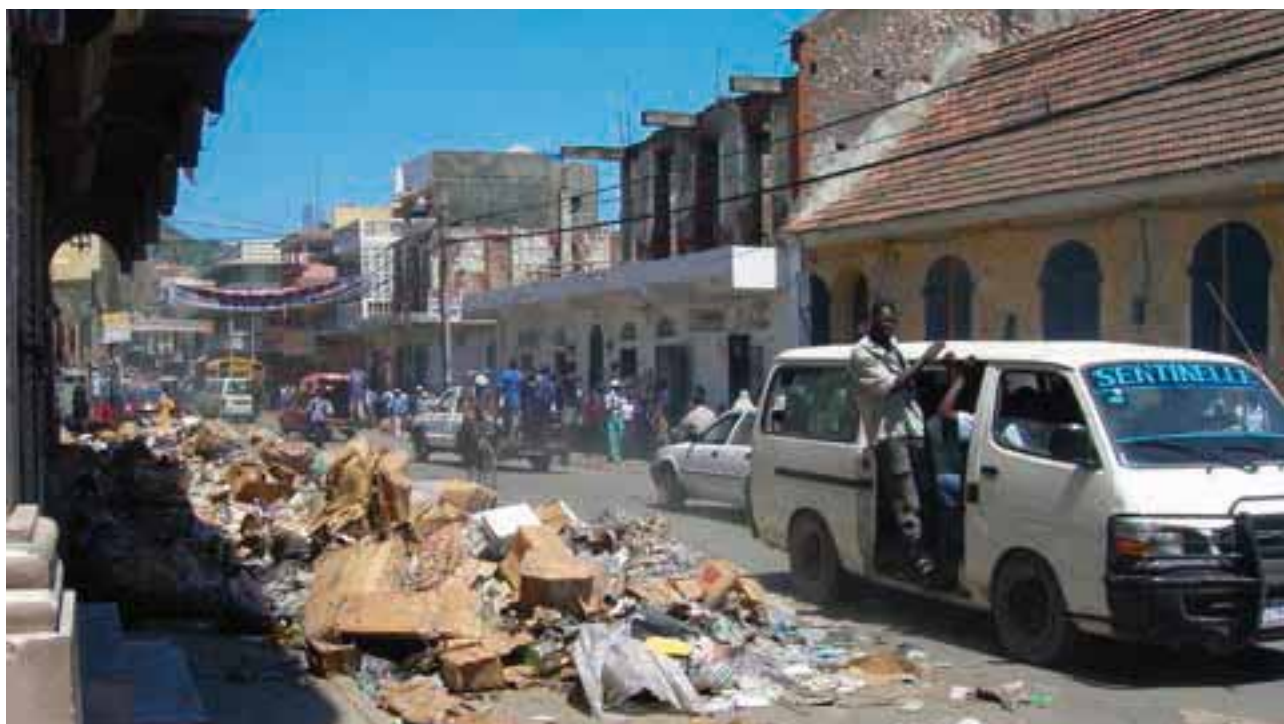
L'Avenue espagnole, une des principales artères du Cap-Haïtien, près du marché.