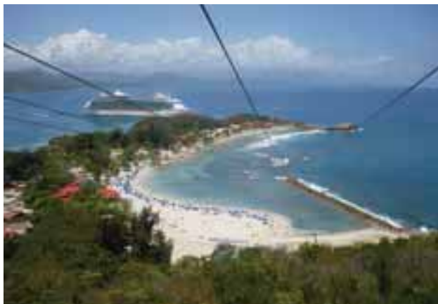
Site touristique de Labadie à proximité du Cap-Haïtien.

6,6 % des unités informelles disposent d'un local spécifiquement réservé à l'exercice de l'activité (marchés publics, ateliers). Les autres se répartissent entre la voie publique (37,8 %) et le domicile (55,7 %), là encore sans local spécifique dans la majorité des cas. La branche d'activité dominante est le commerce (tous commerces de produits primaires et manufacturés confondus). C'est le cas pour 53,7 % des unités, 74,4 % du chiffre d'affaires et 57,5 % de la valeur ajoutée réalisée. Par ailleurs, la plupart des unités se caractérisent par de faibles immobilisations d'actifs (locaux, équipements, machines, et autres outillages, etc.).