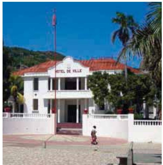
Hôtel de ville du Cap-Haïtien.

Les femmes sont faiblement représentées au sein du cartel avec 2 femmes sur les 9 élus. Les questions d'équité entre les sexes sont prises en compte par l'administration communale sans pour autant être une priorité. Cependant, vu le poids économique et social de la femme dans la société, elle demeure un interlocuteur privilégié, sans pour autant se sentir considérée dans la gouvernance de la ville. Les organisations de femmes sont toutefois très présentes et très actives.