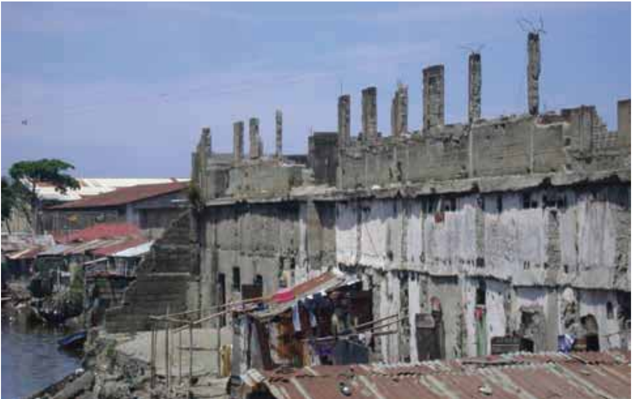
Bâtiment en reconstruction suite au tremblement de terre de 2010.

Cap-Haïtien est une ville naturellement à risque de part sa situation en bord de mer. La ville a déjà été frappée par de graves catastrophes dont un tremblement de terre en 1842 qui a secoué le nord de l'île. Par la suite, une inondation s'est produite en 1963 et plus récemment en novembre 2000 suite au passage du cyclone Georges. La ville est sous la menace constante de raz-de-marée, spécialement au niveau de la zone nan ranblè, dans la localité de Petite-Anse. Par ailleurs, la ville fait face à de sérieux risques de glissements de terrain pendant les périodes de fortes pluies qui ont déjà fait de nombreux morts.