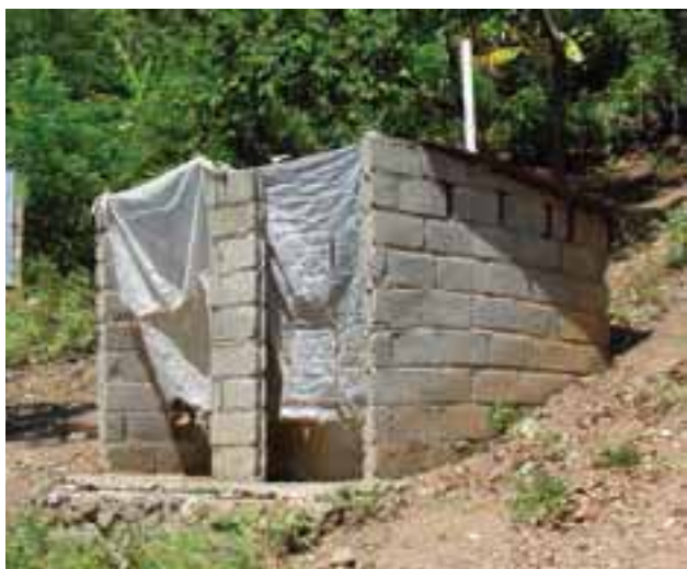
Latrine publique.

Les services publics de collecte des déchets solides sont fournis par la mairie et par le ministère des Travaux publics, transports et communications à travers son service métropolitain de collecte des résidus solides. Le matériel et les moyens logistiques sont en quantité nettement insuffisante pour remplir cette mission et peu de dispositions institutionnelles ont été prises en vue d'apporter une amélioration à la salubrité des villes. Le service formel de ramassage des ordures n'est présent que dans les principales villes du pays mais il est très peu fonctionnel. Toutefois, des compagnies privées s'occupent de collecter régulièrement les ordures ménagères de leur clientèle. La mauvaise gestion des ordures ménagères pose de sérieux problèmes sanitaires. Les déchets sont déversés dans les canaux de drainage, les égouts ou tout simplement déposés sur les trottoirs. Lors de fortes pluies, ces ordures bouchent les canaux d'évacuation des eaux. Dans les zones rurales, ces déchets sont transformés en fumier et utilisés comme engrais pour l'agriculture. Toutefois cette pratique comporte un sérieux problème pour la santé des riverains, car elle engendre la pollution du milieu naturel, y compris l'air ambiant.