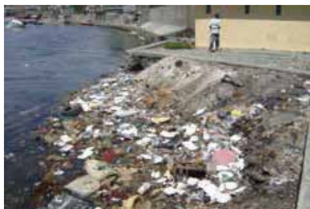
Décharge sauvage dans le port.