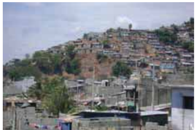
Reconstruction des quartiers précaires.

Avant le tremblement de terre, 60 % des gens louaient leur maison ou leur terre. La chute des revenus et l'augmentation des prix ne permettent désormais plus à ces gens de payer leur loyer. Elles restent donc dans les