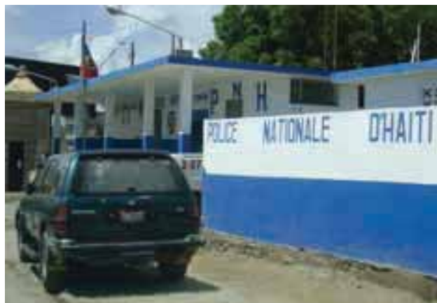
Commissariat du Cap-Haïtien.

Les quartiers de Vertières et de Sainte-Philomène sont des zones difficiles qui hébergent la majorité des populations migrantes. Après les inondations des Gonaïves, il y a bientôt cinq ans, 45 % de la population de cette ville a migré vers le Cap-Haïtien qui n'était absolument pas préparée à accueillir ni à intégrer ce flux massif de nouveaux venus.