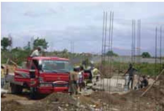
Construction de nouveaux quartiers en périphérie de la ville.

La problématique urbaine de la ville du Cap-Haïtien est liée à sa situation « d'enfermement » physique qui rend extrêmement difficile le réaménagement des espaces de vie. Penser urbanisme, c'est essayer de voir comment donner à chacun le ou les moyens de vivre dans la ville. Puisque le développement spatial est bloqué par les mornes, et que tous les services sont au centre, il y a nécessité à équiper la ville.