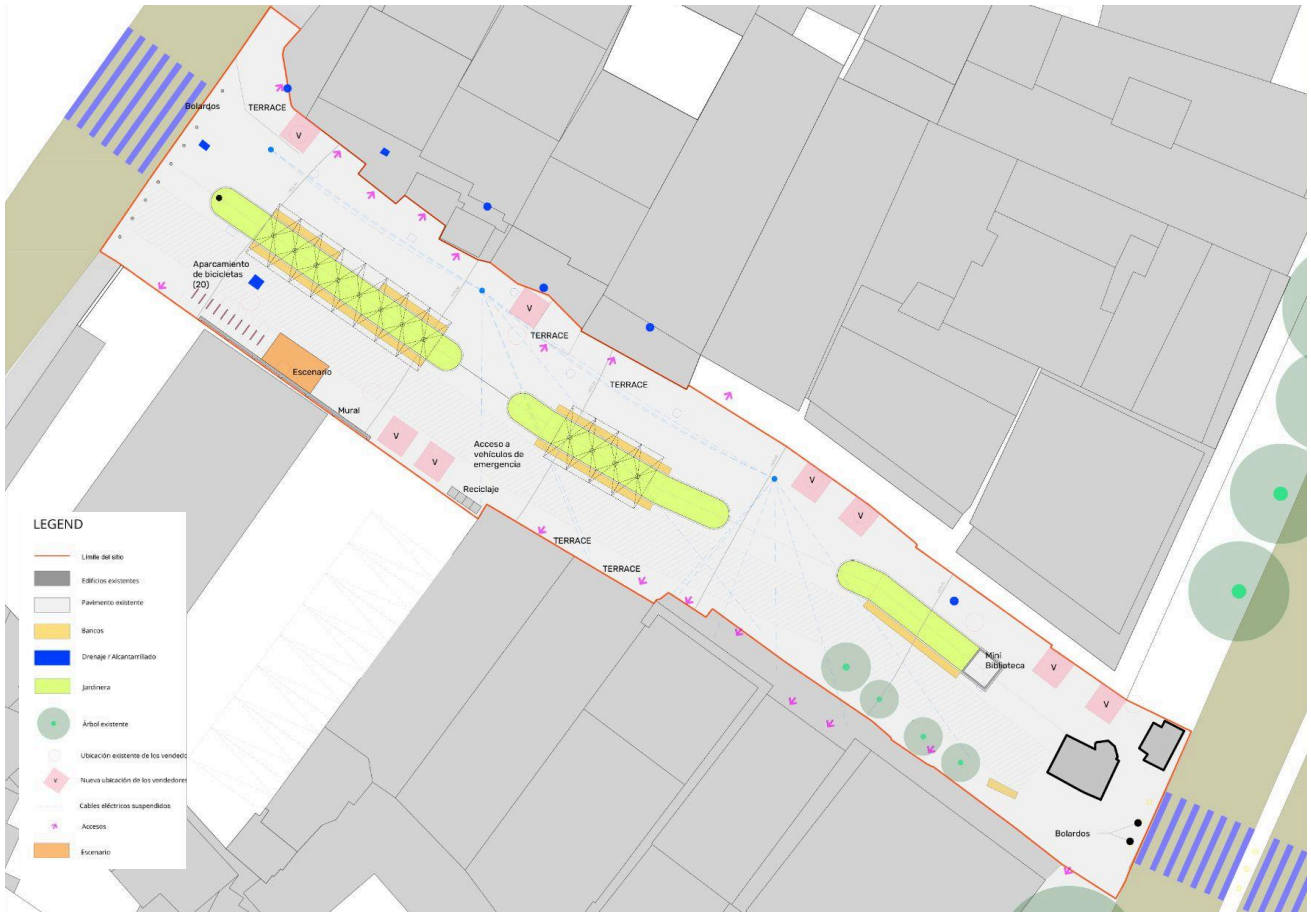
Figura 6. Propuesta de plan maestro

Finalmente, se instalarán cuatro luminarias urbanas solares en el costado occidental, con el fin de mejorar la percepción de seguridad en horas nocturnas y potenciar el uso del espacio público durante la noche.