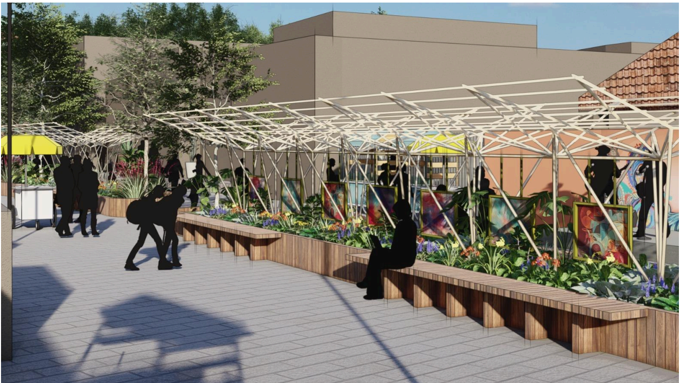
Figura 7 y 8: Calle 12 Peatonal - Renders de la propuesta