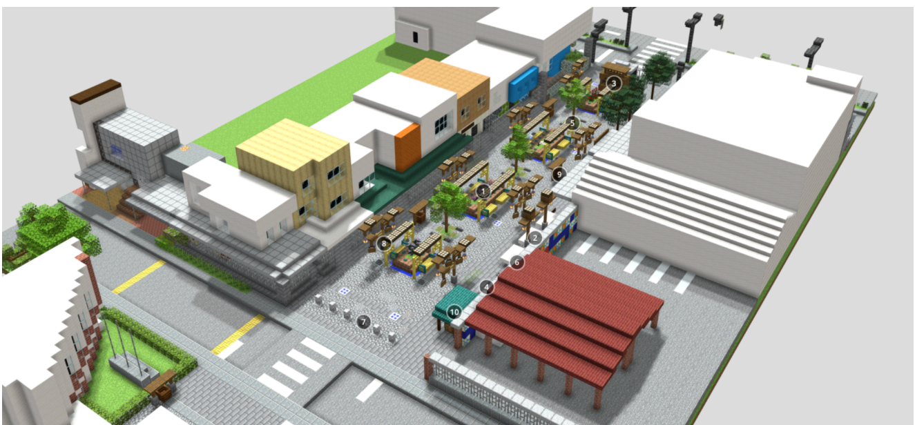
Figura 1. La propuesta de plan maestro de Minecraft elaborada para los jóvenes Young Gamechangers

Posteriormente, EVA Studio transformó esas ideas iniciales en un conjunto de diseños técnicos y planos arquitectónicos, garantizando su viabilidad constructiva y su coherencia con las normativas vigentes. Los resultados aquí presentados representan, por tanto, una síntesis entre la visión y la energía de los Young Gamechangers y el acompañamiento profesional de arquitectos y expertos, con el propósito de materializar un espacio público ejemplar que sirva de referencia para futuros proyectos participativos en Armenia.