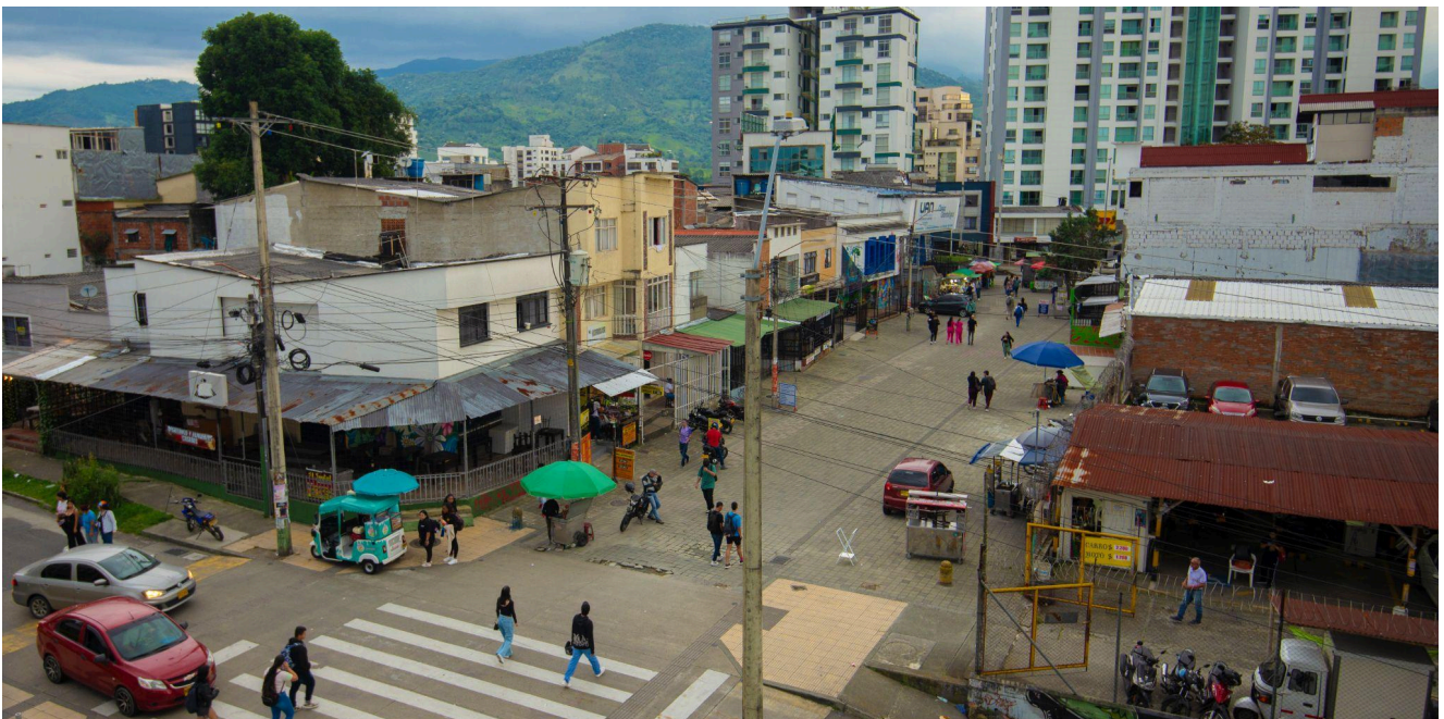
Figura 2. Vista de la peatonal desde UNI Quindio

También la Calle 12 Norte tiene conexión con las avenidas principales como la Avenida Centenario y carreras relevantes del norte. En el año 2015 la Calle 12 Norte ha beneficiado d'uno proyecto de peatonalización en el contexto dos proyectos de mejoramiento de infraestructura vial por la administración municipal 2 .