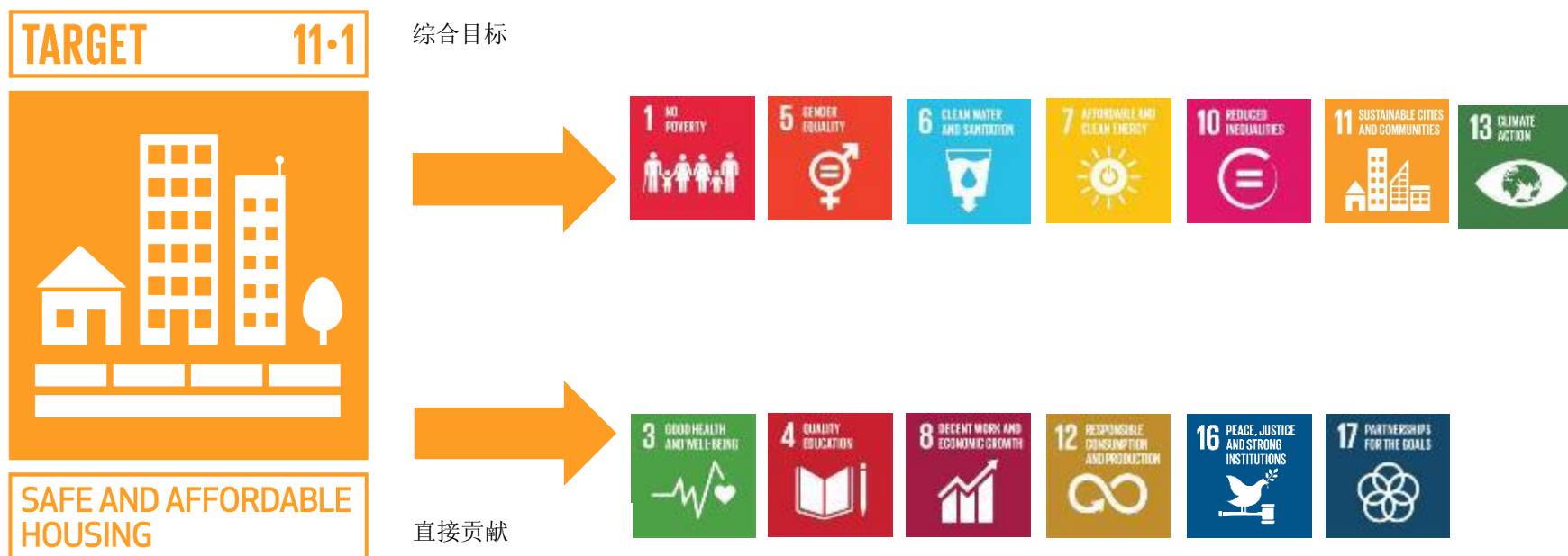
图 2 住房是可持续和包容性发展的核心