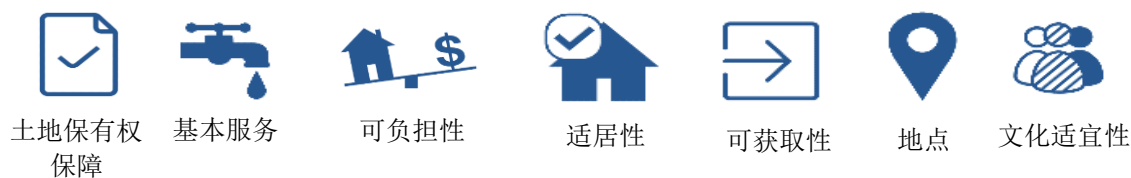
图 1 适当住房的七个方面 10

18. 获得适当住房作为一项基本人权，是新社会契约的基石，对促进包容性、可持续和公平发展至关重要。住房与土地的重要社会和生态功能一样，被视为