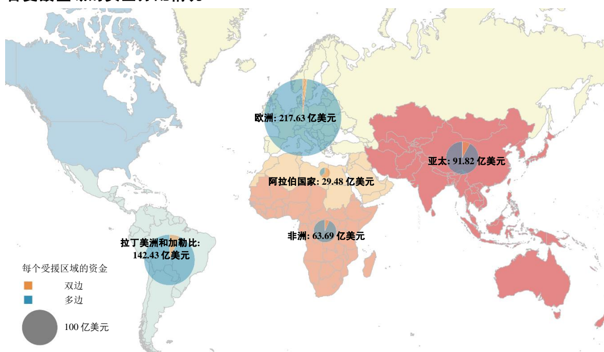
表 5 按受援区域和捐助方类型分列的资金分配情况。多区域项目是指具有跨区域范围的项目。