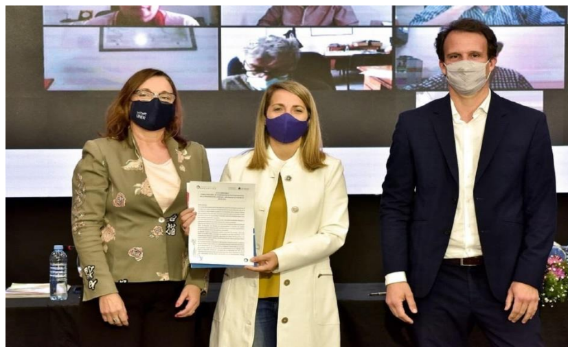
Foto: Firma del Convenio de trabajo entre la Vicegobernación de la Provincia de Entre Ríos (punto focal) con la Universidad Nacional de Entre Ríos.