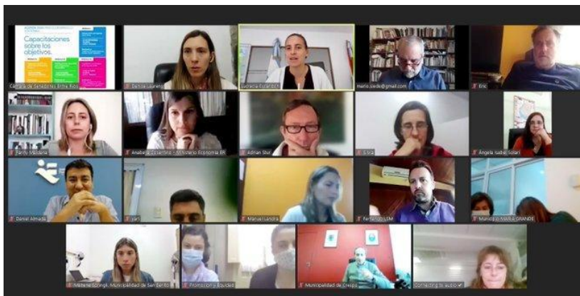
Foto: II Encuentro de capacitación para Municipios en Agenda 2030. Octubre 2021