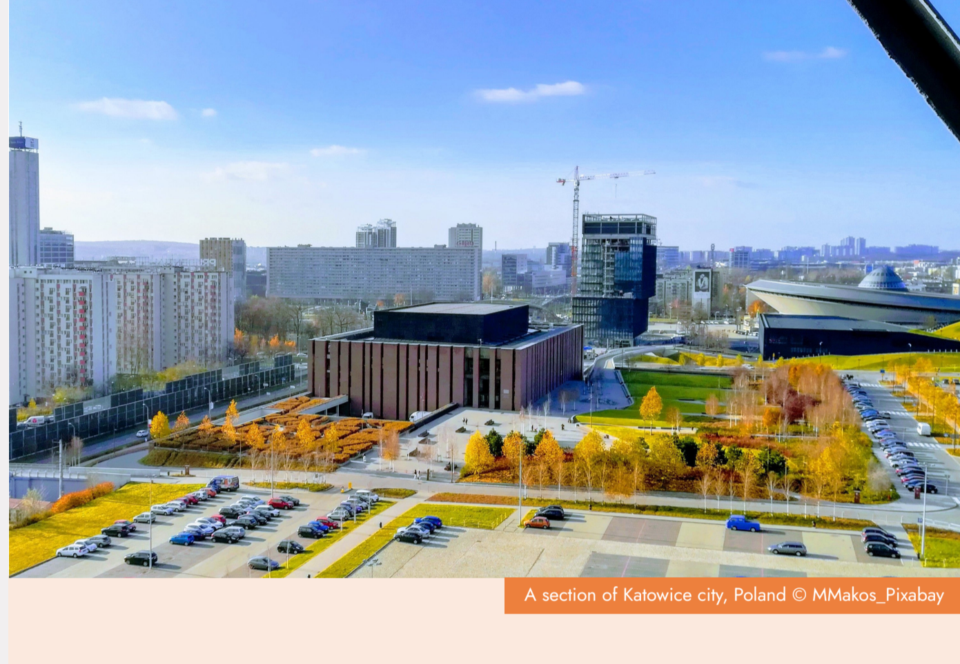
A section of Katowice city, Poland