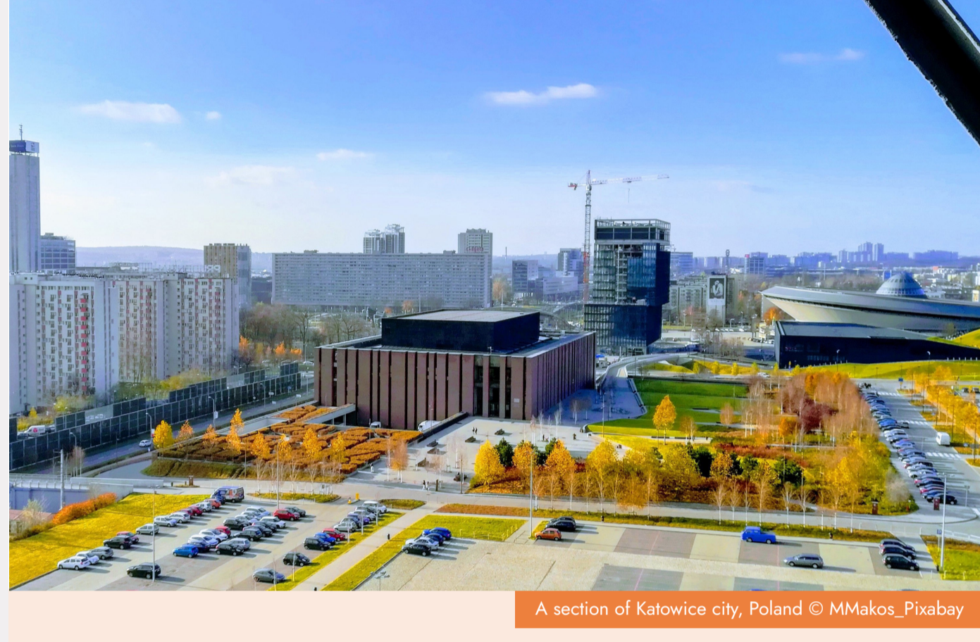
A section of Katowice city, Poland