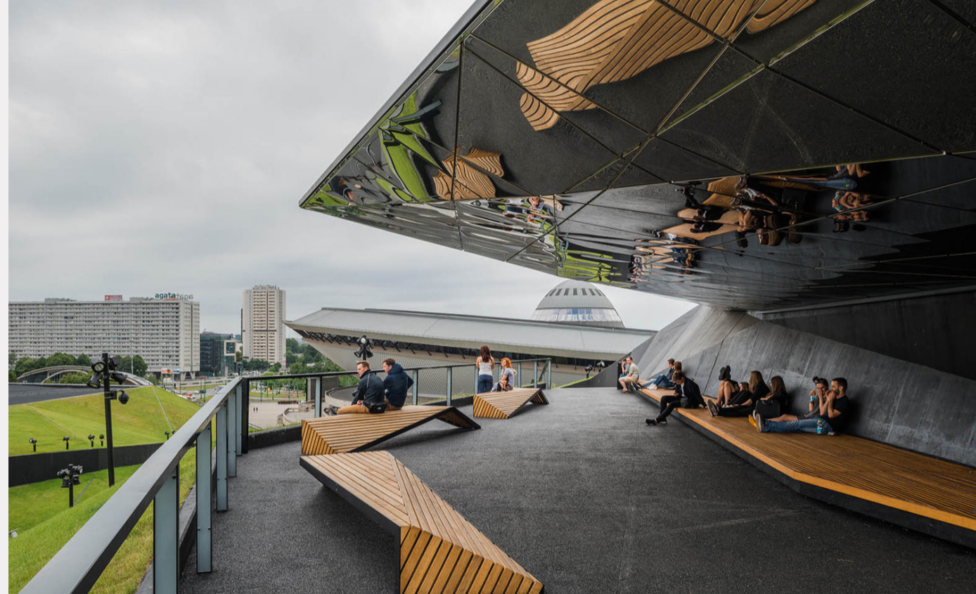
Katowice International Congress Centre / JEMS

Le Centre international des congrès (ICC) a été établi au cœur de la zone culturelle dans un nouvel espace revitalisé près de l'emblématique Spodek et d'autres bâtiments uniques tels que le siège de l'Orchestre symphonique de la radio nationale polonaise et le musée de Silésie. Le bâtiment est un complexe de services multifonctionnel conçu pour accueillir jusqu'à 15 000 invités, il est équipé d'un équipement multimédia moderne, permettant la communication avec les visiteurs et l'organisation efficace d'événements.