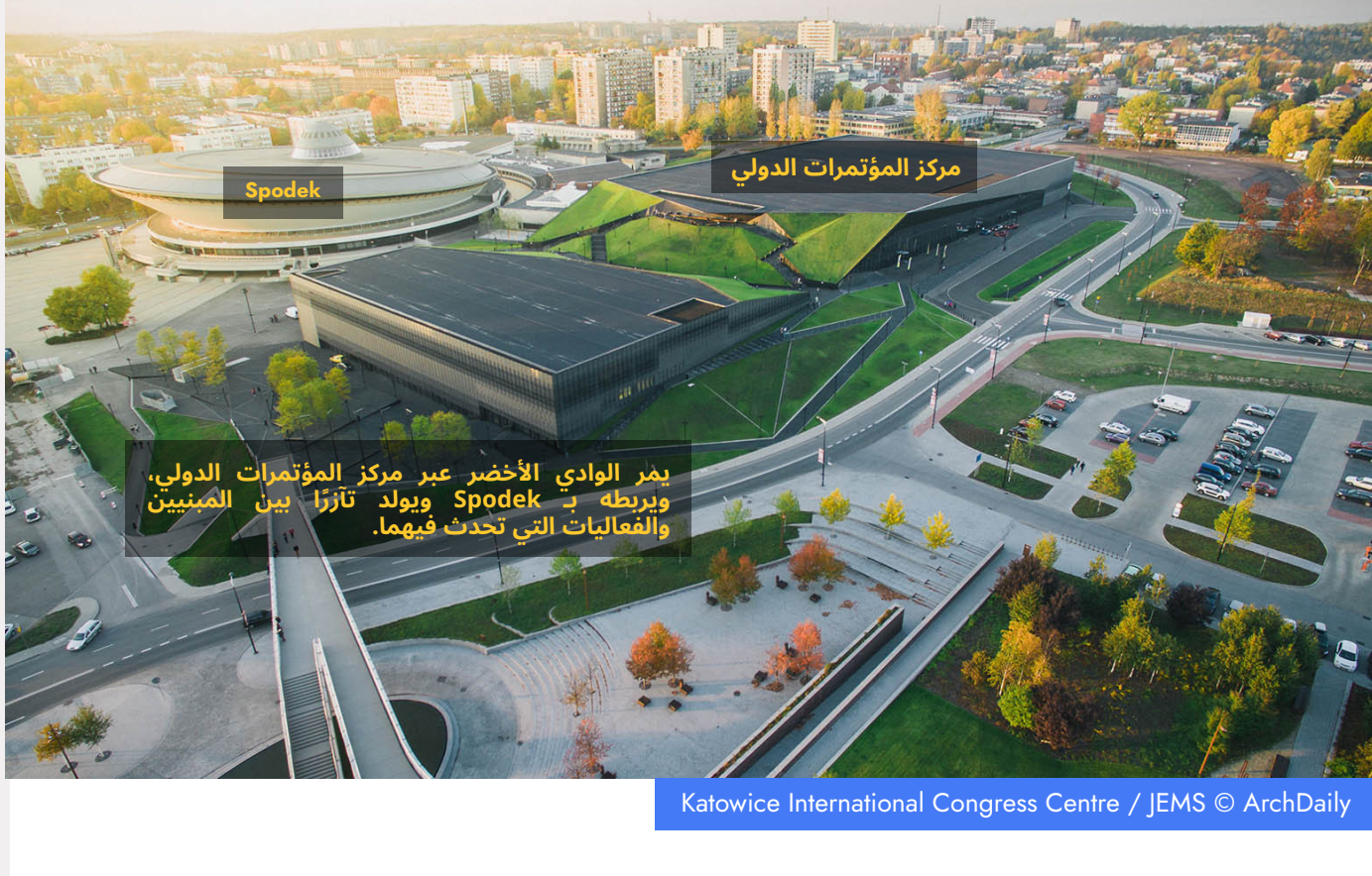
Katowice International Congress Centre / JEMS

تعتبر ساحة Spodek (التي تعني «الصحن» باللغة البولندية)، التي تم بناؤها في عام 1962، واحدة من أكثر الأعمال روعة في العمارة البولندية الحديثة. إنها رمز مدينة كاتوفيتشي ومنطقة سيليزيا العليا الصناعية. كانت الفكرة الرئيسية هي توجيه الهندسة المعمارية الحديثة لكاتوفيتشي مع Spodek لتخلق منطقة ترفيهية جذابة. سيقام WUF11 في ICC، وهو واحد من الرموز الرئيسية في بولندا التي تمثل العمارة المعاصرة التي تقع في منطقة التاريخية.