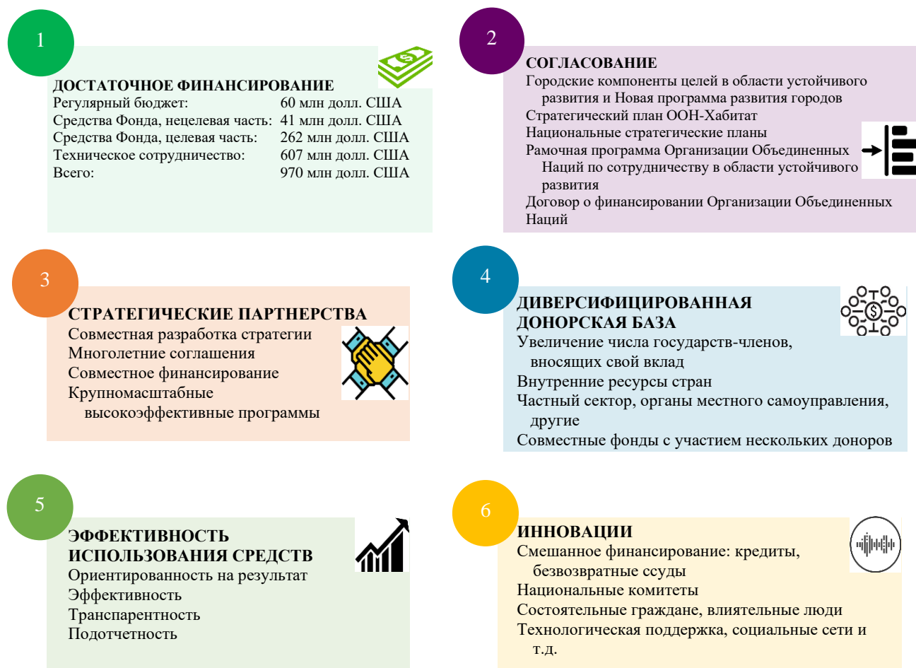
Рис. 1 Цели стратегии мобилизации ресурсов ООН-Хабитат

2. Предварительные сведения о фактических поступлениях для различных видов средств по состоянию на 31 декабря 2020 года приведены на рис. 2 в сравнении с плановыми показателями поступлений. В 2020 году поступило 4,3 млн долл. США в виде взносов в нецелевую часть, из которых 0,3 млн долл. США составили взносы за предыдущие годы. Взносы в сумме 4 млн долл. США (в чистом исчислении) составили 21 процент от планового показателя на год в сумме 18,9 млн долл. США. Учитывая сохраняющиеся трудности с привлечением основных средств, государства-члены утвердили сокращенный бюджет на 2021 год в сумме 10 млн долл. США. Для целевой части средств результат оказался лучше: взносы в целевую часть средств Фонда обеспечили финансирование глобальных программ на сумму 53,2 млн долл. США, что составило 84 процента от планового показателя на год. Взносы в часть средств на техническое сотрудничество составили 138,3 млн долл. США (94 процента от планового показателя на год).