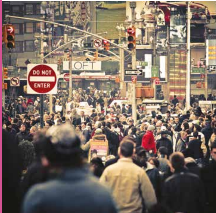
Street in New York, USA