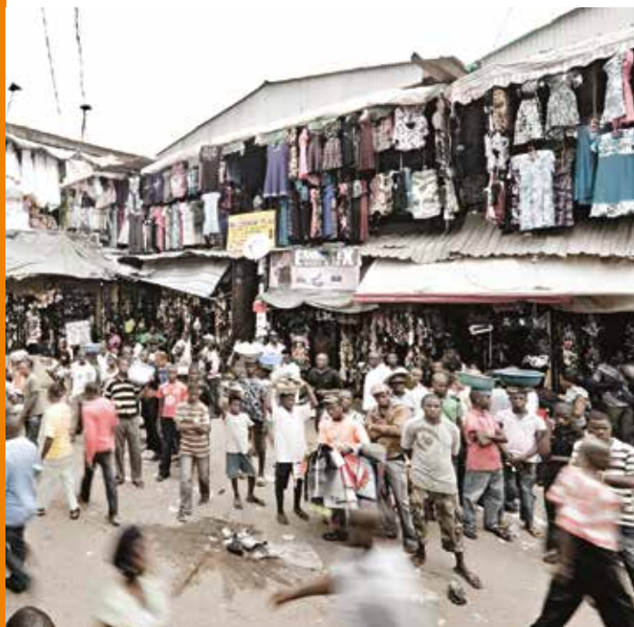
Market place at Onitsha, Nigeria