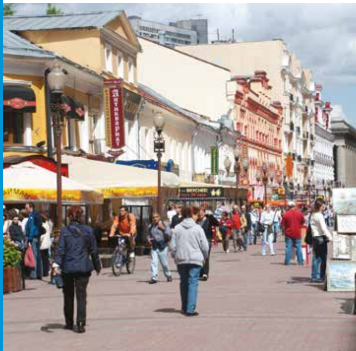
Pedestrian street in Moscow, Russia