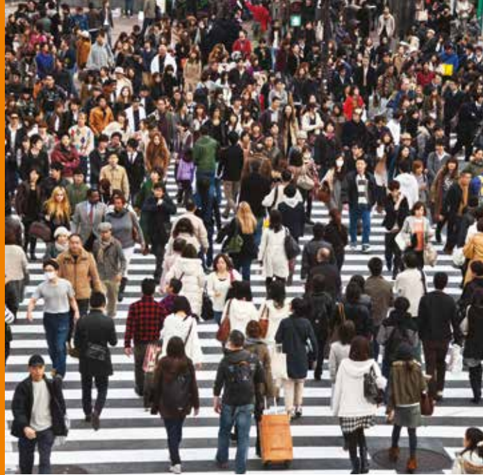
Pedestrians in Tokyo, Japan

Городское и территориальное планирование может способствовать устойчивому развитию различными способами. Оно должно быть тесно связано с тремя взаимно дополняющими компонентами устойчивого развития: социальным развитием и интеграцией, устойчивым экономическим ростом и охраной и рациональным использованием окружающей среды.