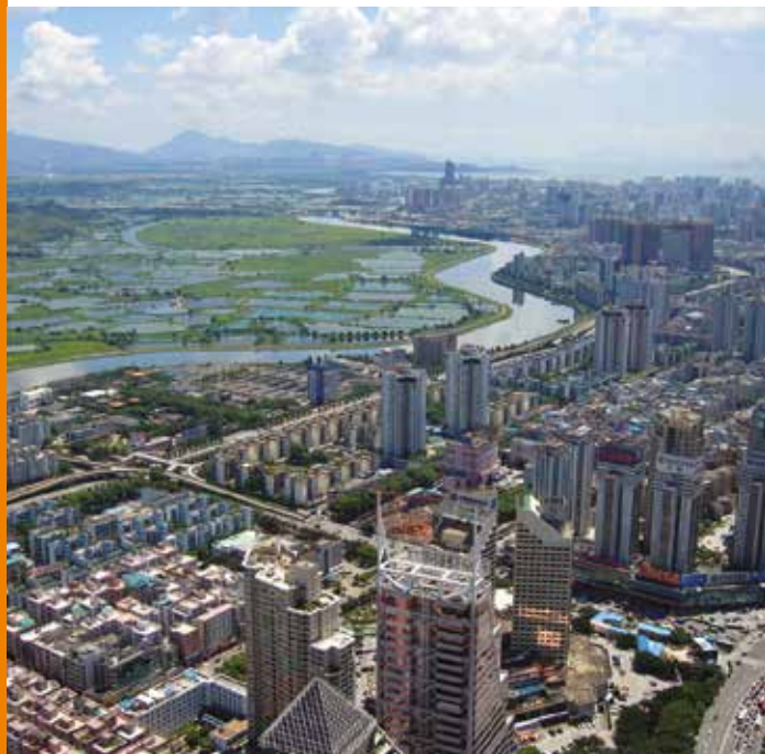
Aerial view of Shenzhen, China