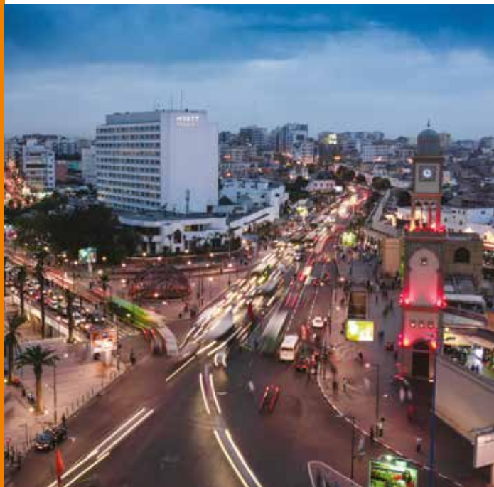
The United Nations square in Casablanca, Morocco