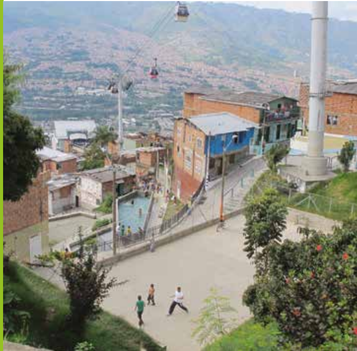
Public space in Medellín, Colombia